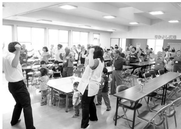
平成25年6月27日 仁和会館 なかよし広場(栄和地区)