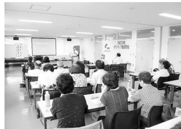
平成25年7月29日 穂別町民センター ボランティア養成研修