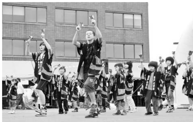
平成25年8月31日 四季の館駐車場 ふれあい広場