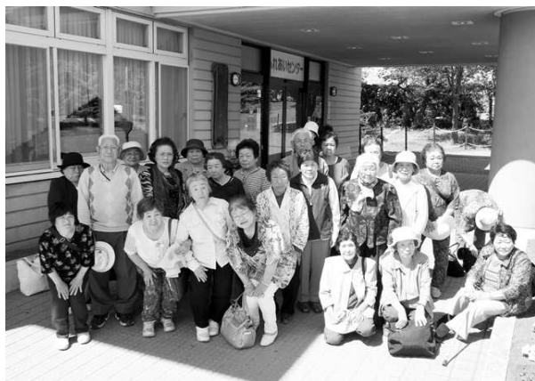
平成25年6月11日 長沼へおでかけ支援 生活支援事業(穂別地区)