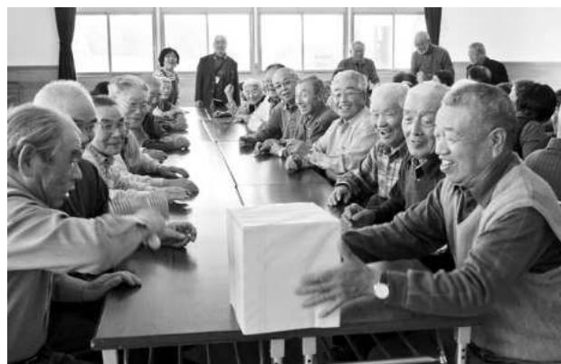
平成25年10月18日 川西第2集落センター なかよし広場(豊城・二宮地区)