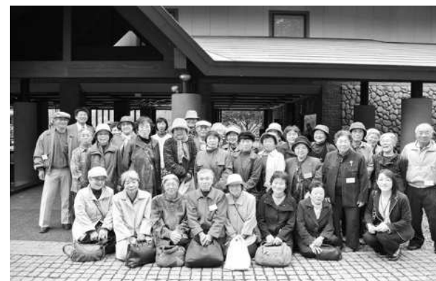
平成25年10月21日 千歳へおでかけ支援 生活支援事業(鵜川地区)

※ 本会では個人情報適切に取り扱い、目的外の用途に使用しません。また許可なく第三者への提供をしません。新聞、広報誌等にお名前を掲載させていただくことがあります。