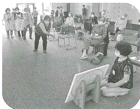
ゲームで体を動かし、楽しみながら健康づくりをする参加者の皆さん (鷺川地区)

「いきいきふれあいサロン」は町内の65歳以上で外出の機会が少なくなった方を対象に、ふまねっと運動やレクリエーション、簡単なゲーム等、参加者全員で楽しく健康づくりを行っています。 昨年度は新型コロナウイルスの感染拡大防止の観点から、両地区とも開催の縮小や中止、ボランティアさんの食事作りも自粛させていただきました。今後も感染状況を見ながら開催を予定しています。 皆様のご参加をお待ちしております。