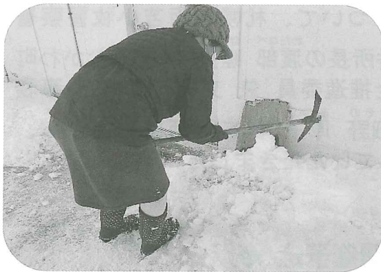
氷割り作業の様子

65歳以上の高齢者等で日常生活に困りごとを抱える 方を支援する「生活支援ボランティア」の氷割り活動を、 穂別地区で2月22日にボランティアさんと社協職員で 実施。この日はむかわ町で大雪が降った後の作業でした が、快くボランティアさんが活動してくださり、依頼者の 方も綺麗になった玄関先を見てとても喜ばれていました。