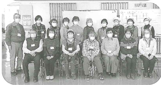
昨年11月に参加して頂いた参加者(上)とボランティアの皆さん(下) (穂別地区)

「いきいきふれあいサロン」は町内の65歳以上で外出の機会が少なくなった方を対象に、ふまねっと運動やレクリエーション、簡単なゲーム等、参加者全員で楽しく健康づくりを行っています。 昨年度は新型コロナウイルスの感染拡大防止の観点から、両地区とも開催の縮小や中止、ボランティアさんの食事作りも自粛させていただきました。今後も感染状況を見ながら開催を予定しています。 皆様のご参加をお待ちしております。