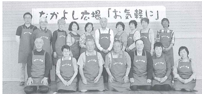
新しいエプロンで心機一転!

第1回地域サロン「なかよし広場」が6月8日川東第1集落センター(宮戸)で、第2回が7月13日川西第1集落センター(田浦)で開催されました。ゲームや昼食、合唱やカラオケなどボランティア・アドバイザーが中心となり開催しています。