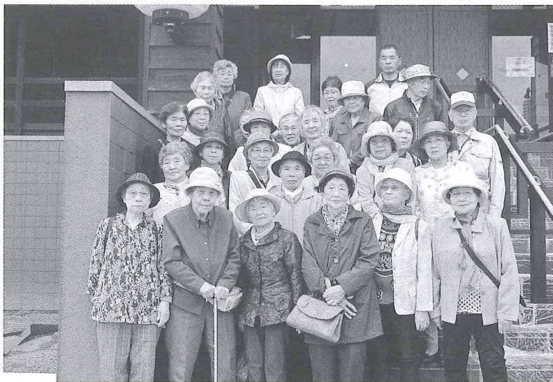
◆ 鶴川地区 6月28日 石狩市天然温泉番屋の湯にて ◆