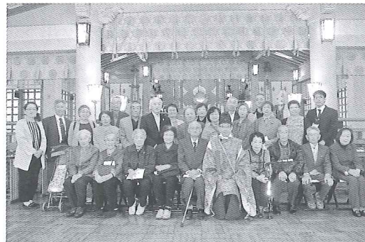
札幌護国神社神殿内にて

26名で(事務局2名)札幌護国神社へ6月13日、参拝旅行が行われました。神殿で参加者1人ひとり玉串奉奠を執り行い献 たまぐちほうてん 花台で戦没者へのご冥福をお祈りしました。