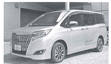
トヨタエスクエア

社協事業に広く使用されることから「かわぐち号」のロゴを入れており、大切に利用します。心より感謝申し上げます。