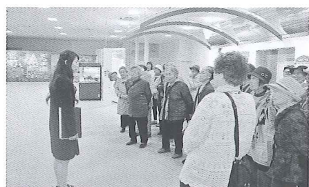
石狩市 ホクレンパールライス工場見学の様子

石狩方面へ6月28日 に参加者26名でおで かけしました。 今回は「パールライ ス工場」でお米の生産工 程を見学し、「石狩番屋の 湯」で参加者同士のんび りと昼食と入浴を楽し みました。 その後、道の駅「花口 ドトエにわ」で面白い物 を満喫し楽しい1日を 過ごしました。