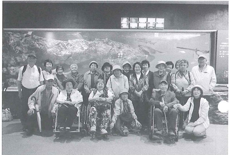
◆ 穂別地区 6月27日 新札幌サンピアザ水族館にて ◆