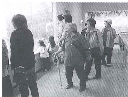
新札幌 サンピアザ水族館 見学の様子

特別地区 新札幌・千歳方面へ 6月27日、24名でおで かけしました。 新札幌では「とり将 軍」でおいしい焼き鳥を 堪能したあと「サンピア ザ水族館」で見学をし、 可愛いお魚たちに癒さ れました。 千歳では「岩塚製菓直 売所」に立ち寄りまし た。味しらの大袋な ど、「ここ」でしか買えない 商品が購入できて、みな さん喜んでいました。