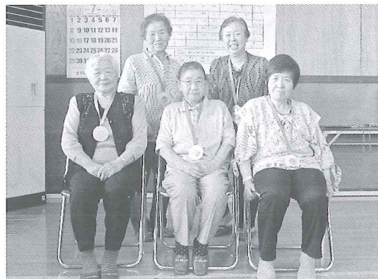
第2回 田浦地区のゲーム優勝チーム