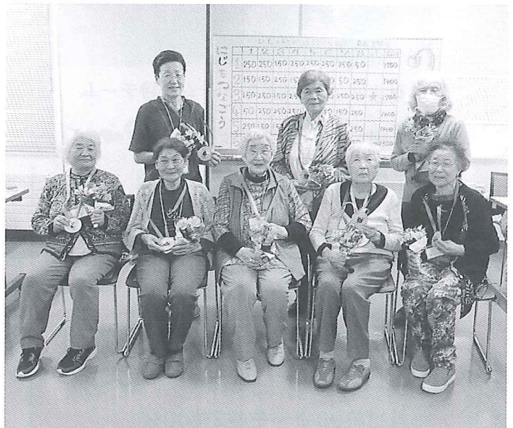
第2回開催の優勝チーム

この時期の開催では、穂別メロンが昼食に登場するのが何より楽しみです。今年は、天候不順のためメロンも大きくなり、メロン確保に苦労しました。担当者が走り回って何とか探し出し、今年も穂別メロンを味わうことができました。メロンの甘さを楽しみ、さわやかな夏の香りを感じることができ何よりでした。