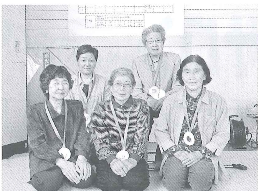
第1回 宮戸地区のゲーム優勝チーム

次回は9月6日(木)に川東第2集落センター(生田)で開催予定です。皆様のご参加をお待ちしています!