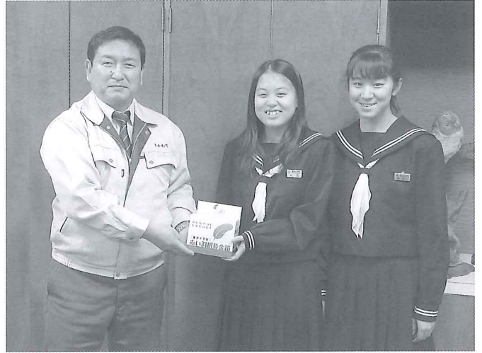
穂別中学校 生徒会の皆さま