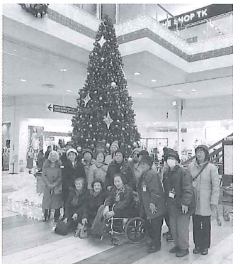
「イオン苫小牧店」の クリスマスツリーの前で★