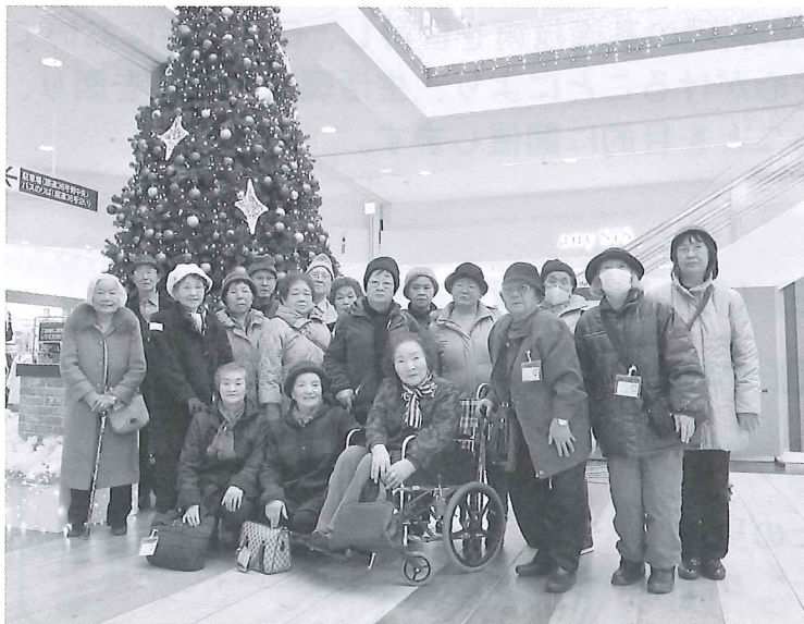
◆穂別地区◆ イオン苫小牧 食事・買い物 (苫小牧市)