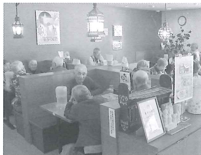
「えにわ温泉ほのか」で ランチタイム♪

鵜川地区は12月19日、総勢 22名で、千歳市にある「カルビー 株式会社」の工場見学と恵庭市の 「えにわ温泉ほのか」で昼食・入浴 を行いました。