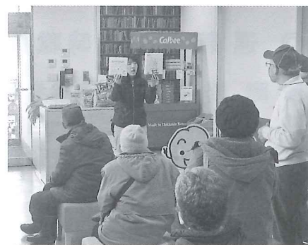
「カルビー株式会社」での 工場見学の様子

工場見学ではジャガイモの選別 作業からポテトチップスが出る までの行程を見学。参加者は熱心に 質問や見学をしていました。帰り にはお土産も頂きました。