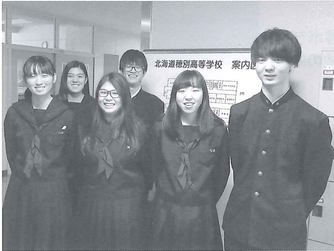
穂別高等学校 生徒会の皆さま

胆振東部地震直後の大変な中でご協力いただき、心より感謝しております。ありがとうございました。じぶんの町を良くする（元気にする）ために使わせていただきます。