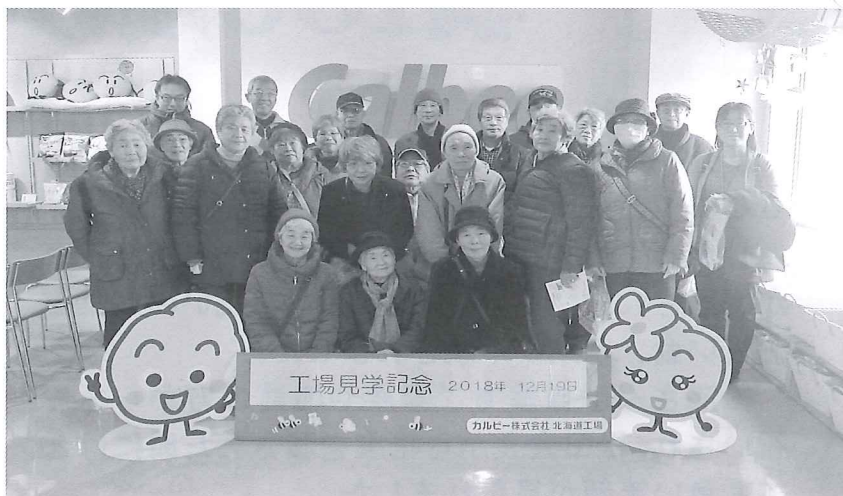
◆鶴川地区◆ カルビー株式会社 工場見学 (千歳市)