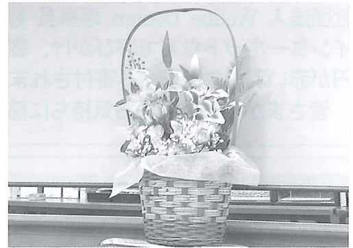
本物の花のような造花アレンジ