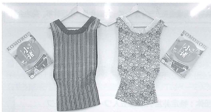
様々な色や模様の「ねこ半纏」

長野県小諸市公民館女性学級有志の皆さまに より作成された「ねこ半纏」を、12月10日、寄贈していただきました。