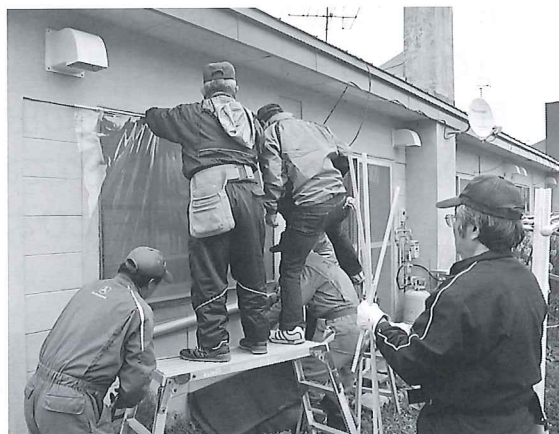
ボランティア柏葉会によるビニール張り

今年は、4軒のお宅にビニールを張っていただきました。柏葉会の皆さん、ありがとうございました。