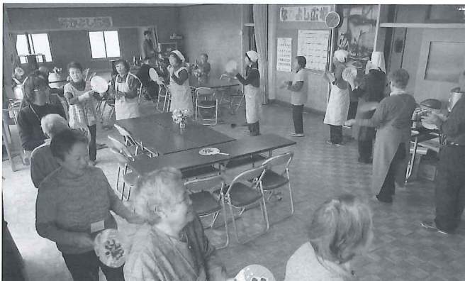
みんなで穂別音頭を踊りました

毎年、栄和保育所の園児さんの出し物は参加者のみなさんも楽しみにされており、今年は黄色い服に卵の殻をかぶったひよこの衣装で踊りを披露してくれました。