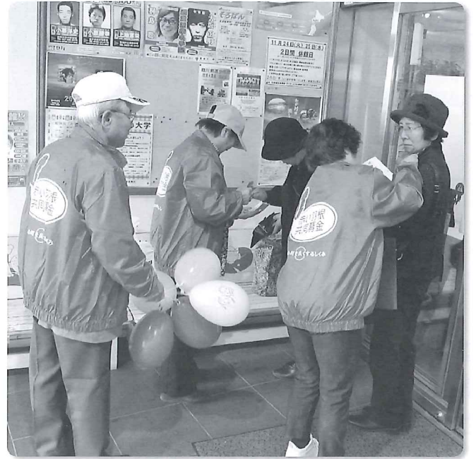
鶴川地区文化祭で街頭募金（共同募金役員、鶴川地区民生委員）