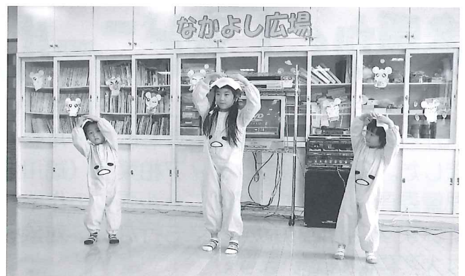
栄和保育所の園児によるかわいい踊り