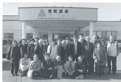
恵庭温泉ラ・フォーレにて

清々しく気持ちの良いお天気で、道中は紅葉も楽しみながらの秋らしいおでかけとなりました。