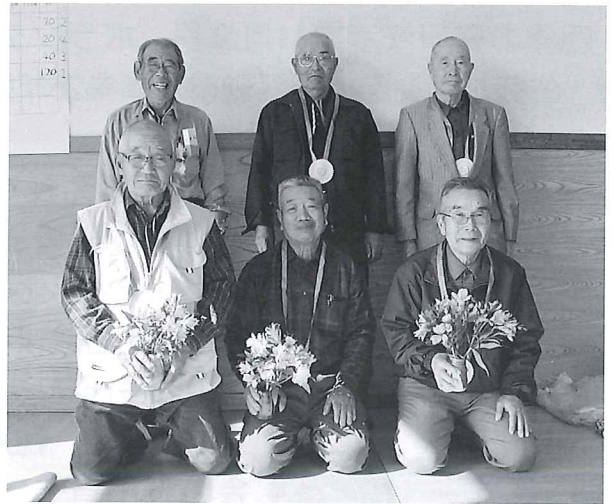
第4回 豊城地域のゲーム優勝チーム