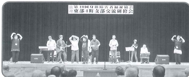
スマイル4ビートミニコンサートの様子