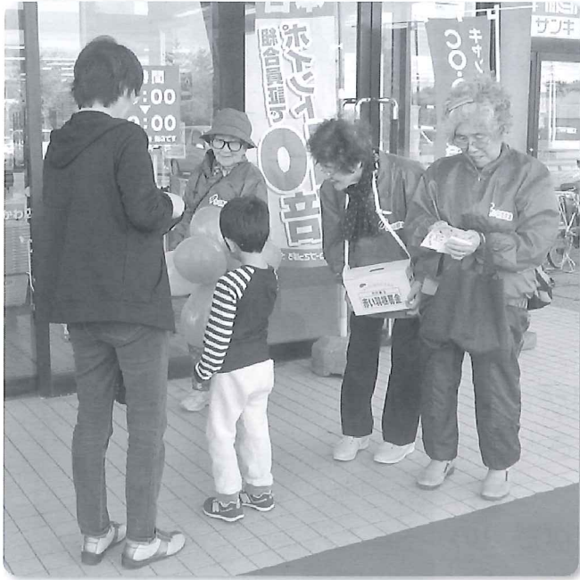
パセオ鶴川店で街頭募金（むかわ町つくしの会会員）