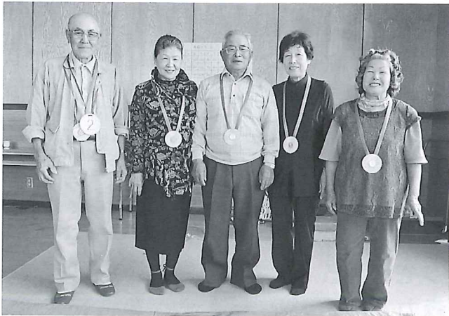
第3回 生田地域のゲーム優勝チーム

「なかよし広場」の第3回が9月25日川東第2集落センター(生田)、第4回が10月30日川西第2集落センター(豊城)で開催された。パズルやクロスワード、グループ対抗の魚釣りゲームで盛り上がり、楽しい一日を過ごしました。