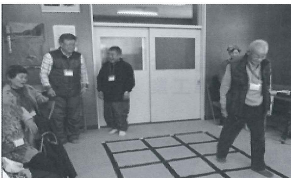
ふまねっと運動をする参加者