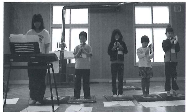
富内小学校の生徒による楽器演奏

今年は富内小学校の皆さんに初めてご参加いただき、生徒さんの発表してくれた楽器演奏・クイズ・歌に、参加者の皆さんも大変喜ばれていました。