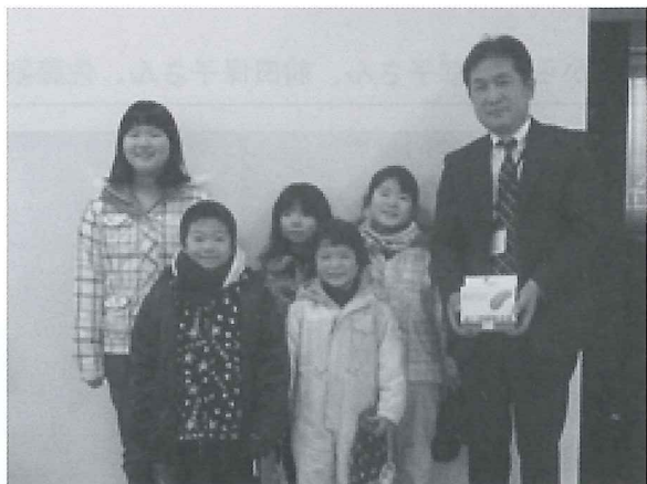
富内小学校児童会のみなさん