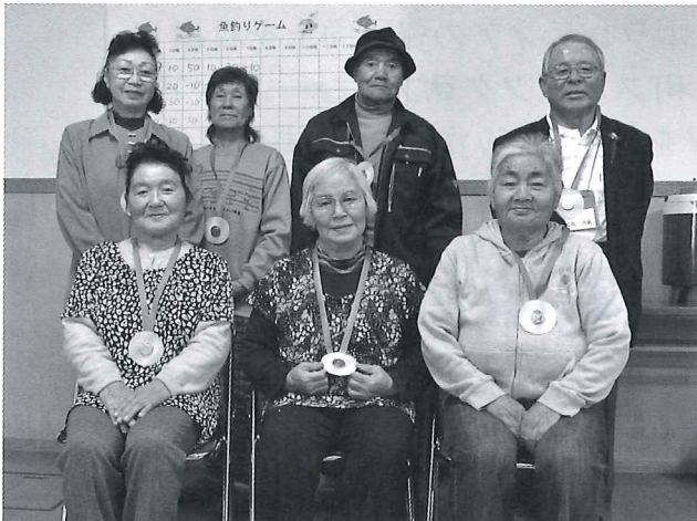
第5回 汐見地域のゲーム優勝チーム

ボランティア・アドバイザーが中心となり開催している地域サロン「なかよし広場」の第5回が11月11日むかわ町漁村センター(汐見)、第6回が12月6日むかわ町四季の館(美幸)で開催されました。おなじみの大型パズルや魚釣りゲームで盛り上がり、昼食のおいしいカレーを食べ、午後は合唱やカラオケで楽しい一日を過ごしました。