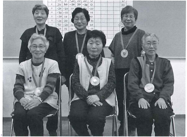
第6回 市街地域のゲーム優勝チーム