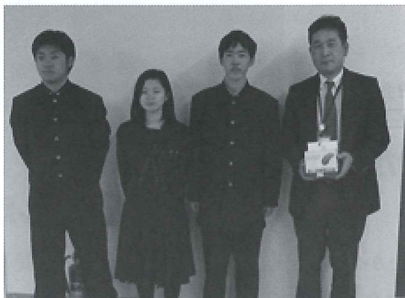
穂別高校生徒会のみなさん