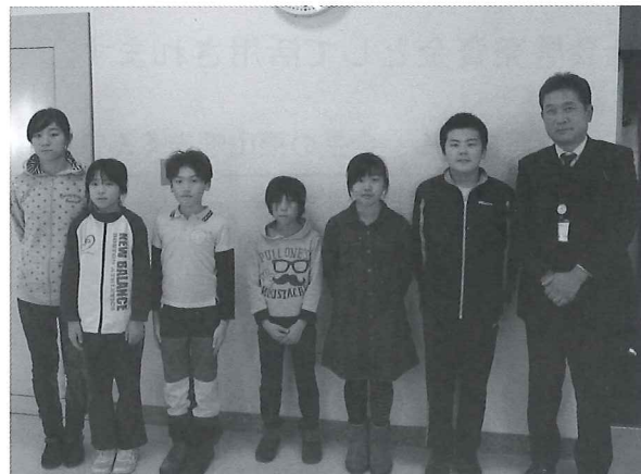
穂別小学校児童会のみなさん