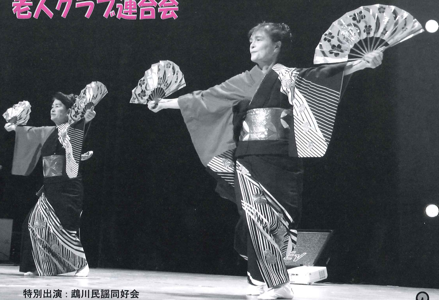
特別出演：鶴川民謡同好会