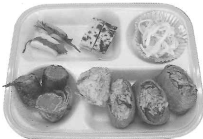
簡単なます、フライパン伊達巻き、かまぼこの梅はさみ、豚肉の紅白巻き、2種類のいなり寿司の5品

令和6年度の「男の料理教室」を12月18日に「まなぶ館」で全地区を対象に開催しました。