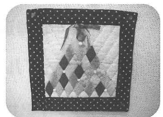
12月のミニギャラリー