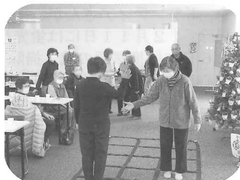
12月のふまねっと運動の様子

午後のレクリエーションは、ボウリングを行い、白熱したレクリエーションとなりました。