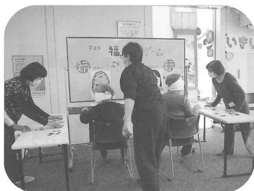
1月のレクリエーションの様子