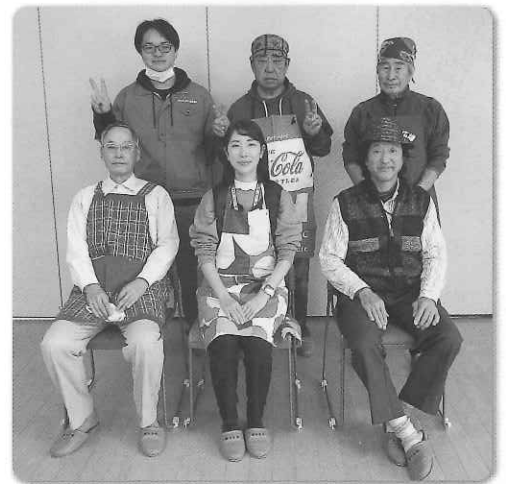
今回、参加していただいた皆さん

皆さん手際が良く、予定より調理が早く進み、自ら調理したおせち料理をゆっくり味わうことができました。