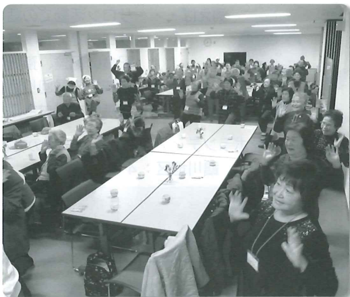
きよしのズンドコ節体操の様子

昼食の調理や受付、参加者とおしゃべり、ゲームのお手伝いなどボランティアを随時募集しております。詳しくは、むかわ町社会福祉協議会 穂別支所 (Tel.45-3874) までお問い合わせ下さい。