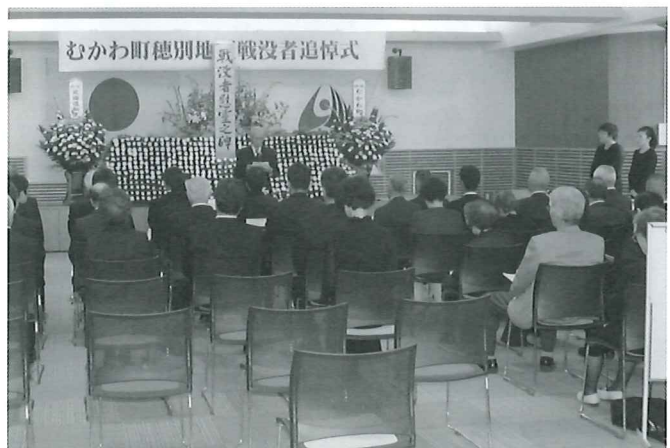
穂別町民センターツツジホールにて

8月7日、町主催の穂別地区戦没者追悼式が穂別町民センターツツジホールで執り行われた。