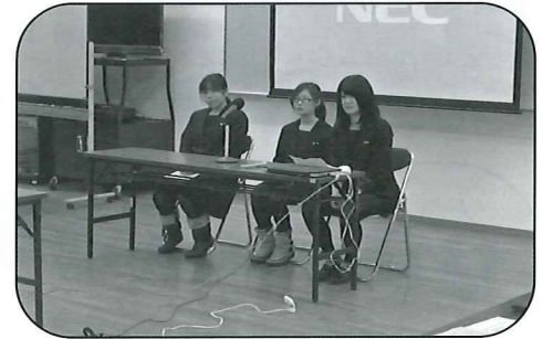
鶴川高校の活動報告（平成25年11月）

地域でボランティア活動をすでに実践されている方や、ボランティアに関心を寄せている方に研修の機会を提供し、ボランティアがより身近な地域活動としてすそ野を広げ、地域に根ざしたボランティア活動の一層の進行をはかることを目的に研修会を開催します。