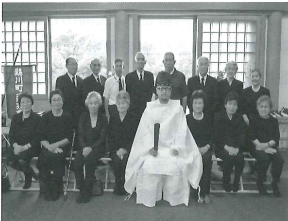
鵜川神社境内にて