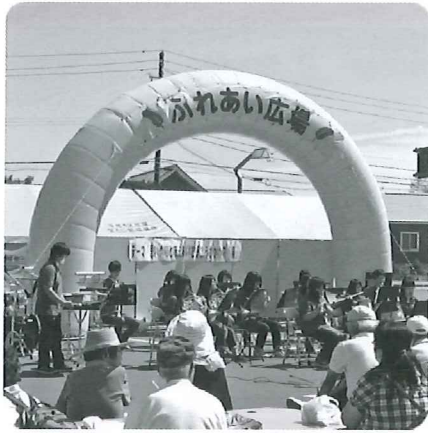
鷗川高校吹奏楽部