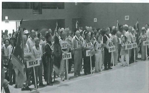
開 会 式