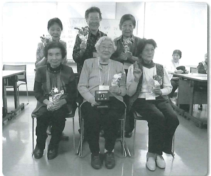
今回のゲーム優勝チーム

是非、参加しておいしい料理を体験してみてください。申し込みは、むかわ町社会福祉協議会 穂別支所 (Tel 45-3874) まで。