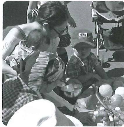
介護者とともに歩む会「ヨーヨーつり」