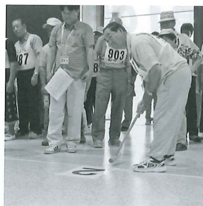
ゲートボール通過