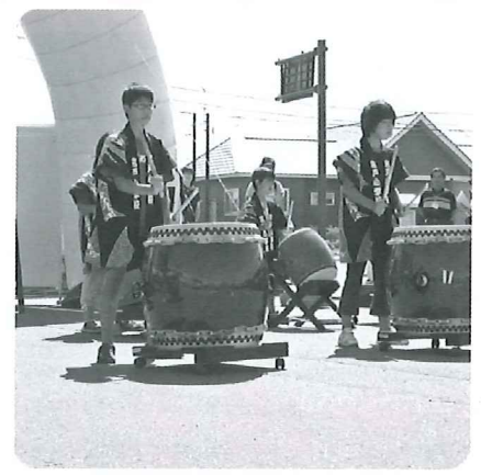
宮戸小学校の龍神太鼓

平成26年度第22回ふれあい広場を8月30日、むかわ町四季の館駐車場で開催した。当日は、晴天に恵まれ、10時に宮戸小学校の龍神太鼓の演奏で開会。今年にはむかわ町社会福祉協議会の第4期地域実践計画（平成24年度～28年度）を目標に「思いやりと支えあいで築こうむかわの『輪』」をテーマに掲げ開催。開会式後、ほべつ誠光のコーラス、鷗川中学校吹奏楽部の演奏、スノードロップスのヒップホップダンス、鷗川高等学校吹奏楽部の演奏が披露された。盛りだくさんの催しに参加者から喜びの声援が上がりました。今年も、認定こども園の園児絵画展示、マジックバルーンや昨年は雨でおこなわれなかった子ども限定のもちつき体験で、つきたてのお餅も配布された。最後のビンゴ大会も大盛況のなか閉会となりました。 このふれあい広場に、むかわ町、むかわ町教育委員会の後援をはじめ、会場を提供された四季の館、出店や昼食、会場設営等で協力された民生児童委員協議会、むかわ町婦人ボランテニアさつき会、鷗川ライオンズクラブ、支え合い共に生きる会、ほべつ就労・支援センター、介護者と共に歩む会、むかわ町民生活課、むかわ町稲作研究協議会、ハート&ハートワーク、ポパイ