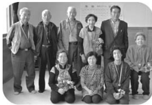
第4回 豊城地域のゲーム優勝チーム