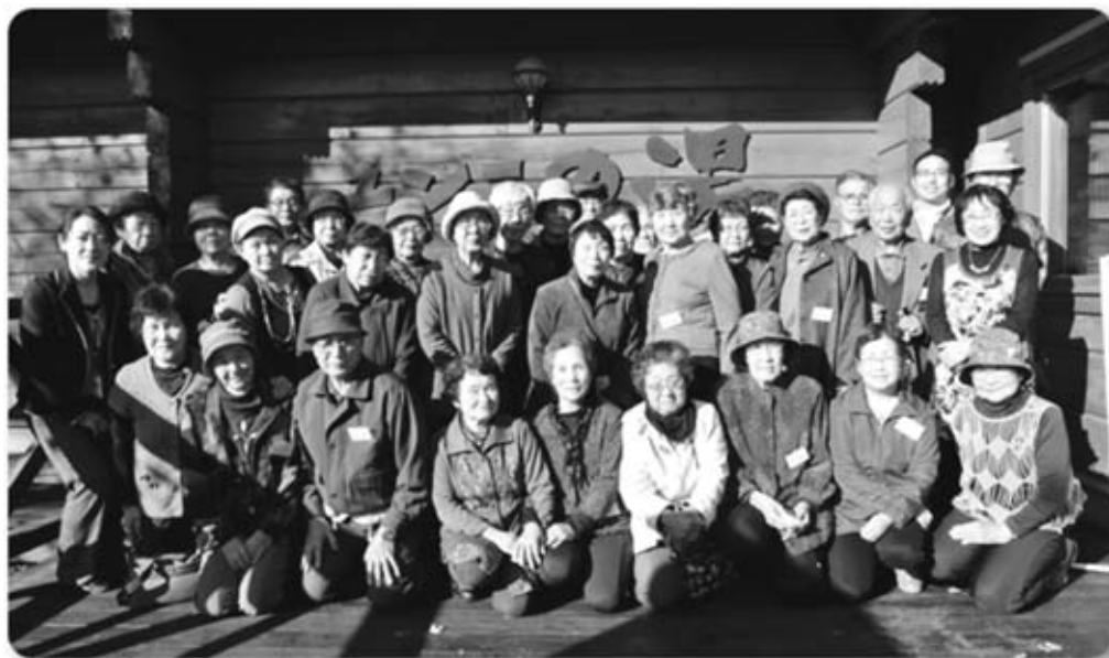
鶴川地区で10月24日、新千歳空港とユソニの湯