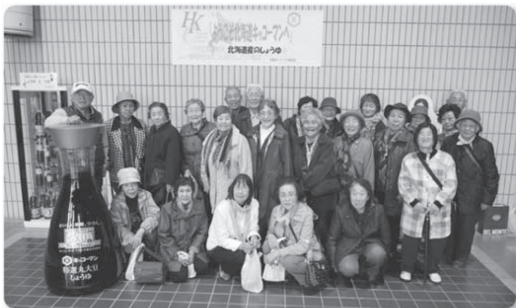
穂別地区で10月28日、キッコーマン千歳工場と恵庭温泉

この事業は、在宅の独居及び高齢者夫婦世帯を対象に、お楽しみ行事や買い物、交流会、ドライブ、温泉入浴等へお出かけ支援を目的に鶴川・穂別両地区、年2回開催。次のご参加お待ちしております。