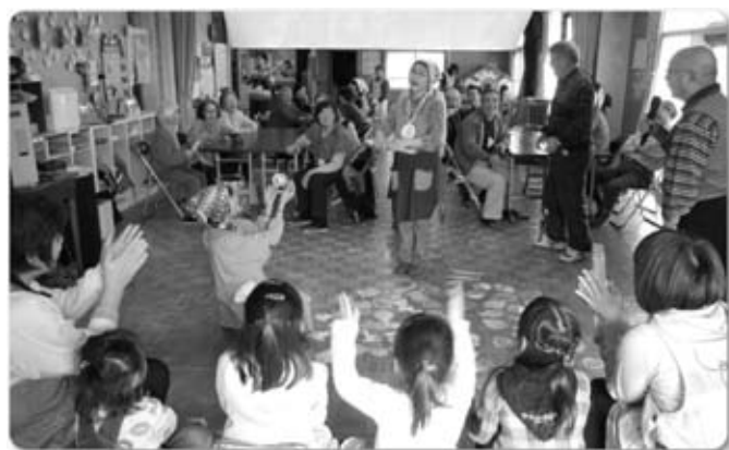
ゲームは、前半は接戦、後半は園児に離される一方でした

ジャガイモ、なす、シイタケなどがトッピングされた豪華でおいしい「野菜カレー」でした。