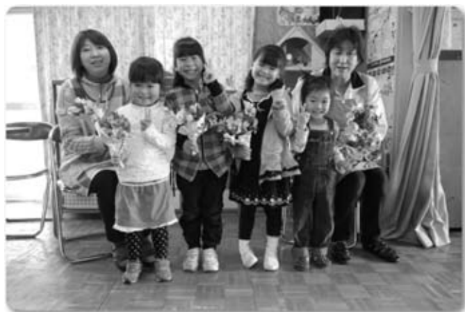
6人姉妹のような富内保育所チームが優勝！