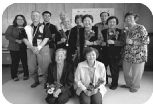
第3回 生田地域のゲーム優勝チーム

第3回の「なかよし広場」で66名、第4回で56名が参加。パズルや昔遊んだカルタ、グループ対抗の魚釣りゲームで盛り上がり優勝チームにはチョコ金メダルが渡され記念撮影、楽しい一日を過ごしました。